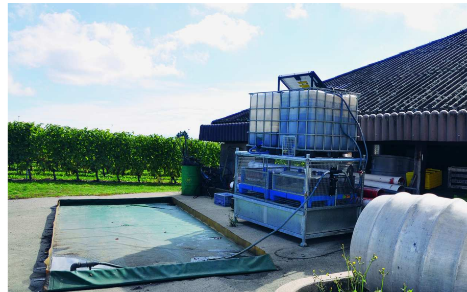
Piscinetta mobile per il lavaggio, con sistema Osmofilm, presso il Centro di formazione Marcelin, M. Hochstrasser